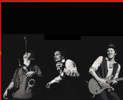
ESPAI DUAL Be God Is