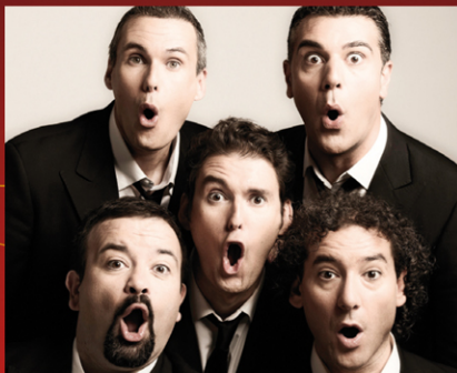
B VOCAL Diversiones originales