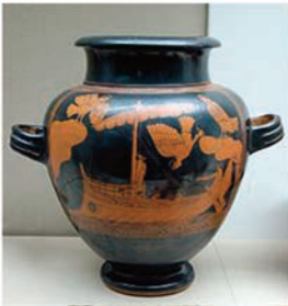
barcos griegos, romanos y cuaderñas