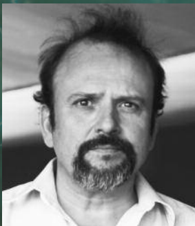
Juan Cavestany text teatral

Novel·lista nord-americà. La dificultat per trobar una feina estable el va portar, el 1841, a embarcar-se en un vaixell balener. Fruit de les seves experiències en alta mar va escriure Typee (1846) i Omoo (1847). El 1847 va publicar Mardi , el 1849 va aparèixer Redburn i, un any després, Chaqueta blanca , una obra en la qual explicava les condicions de vida d'un vaixell de guerra de la marina nord-americana de la meitat del s. XIX. El 1850 va publicar Moby Dick , que es va acabar convertint en una de les grans obres de la literatura universal. Pierre (1852) i Cuentos de Piazza (1856) -que contenia el relat Bartleby el escribiente. Una historia de Wall Street , considerat un dels antecedents de l'obra de Kafka- deixaven veure el creixent menyspreu de l'autor per la hipocresia humana. Israel Potter (1855) i El confident (1857) van ser les últimes obres que va publicar en vida. Des d'aleshores, Melville va assolir la categoria de geni immortal de la literatura.