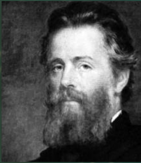
Herman Melville autor

Novel·lista nord-americà. La dificultat per trobar una feina estable el va portar, el 1841, a embarcar-se en un vaixell balener. Fruit de les seves experiències en alta mar va escriure Typee (1846) i Omoo (1847). El 1847 va publicar Mardi , el 1849 va aparèixer Redburn i, un any després, Chaqueta blanca , una obra en la qual explicava les condicions de vida d'un vaixell de guerra de la marina nord-americana de la meitat del s. XIX. El 1850 va publicar Moby Dick , que es va acabar convertint en una de les grans obres de la literatura universal. Pierre (1852) i Cuentos de Piazza (1856) -que contenia el relat Bartleby el escribiente. Una historia de Wall Street , considerat un dels antecedents de l'obra de Kafka- deixaven veure el creixent menyspreu de l'autor per la hipocresia humana. Israel Potter (1855) i El confident (1857) van ser les últimes obres que va publicar en vida. Des d'aleshores, Melville va assolir la categoria de geni immortal de la literatura.